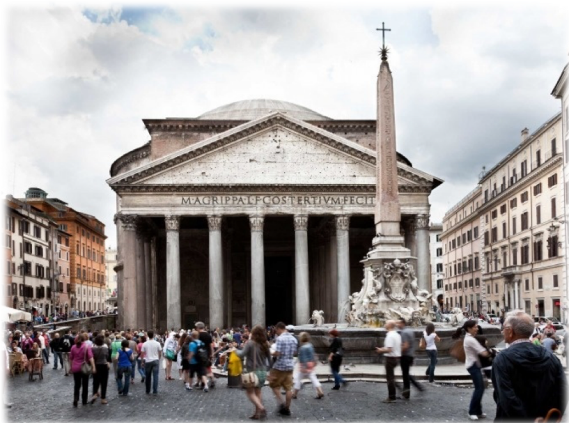
Pantheon - Roma