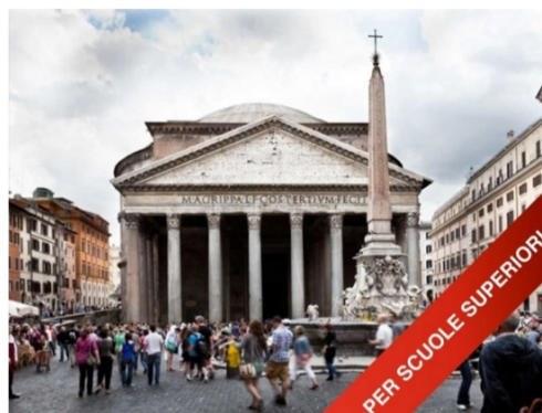
OMGI DIGITAL EXPERIENCE UFFICIALE DEL PANTHEON - TOUR PER LE SCUOLE SUPERIORI 45 MIN.