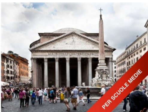
OMGI DIGITAL EXPERIENCE UFFICIALE DEL PANTHEON - TOUR PER LE SCUOLE MEDIE 45 MIN.