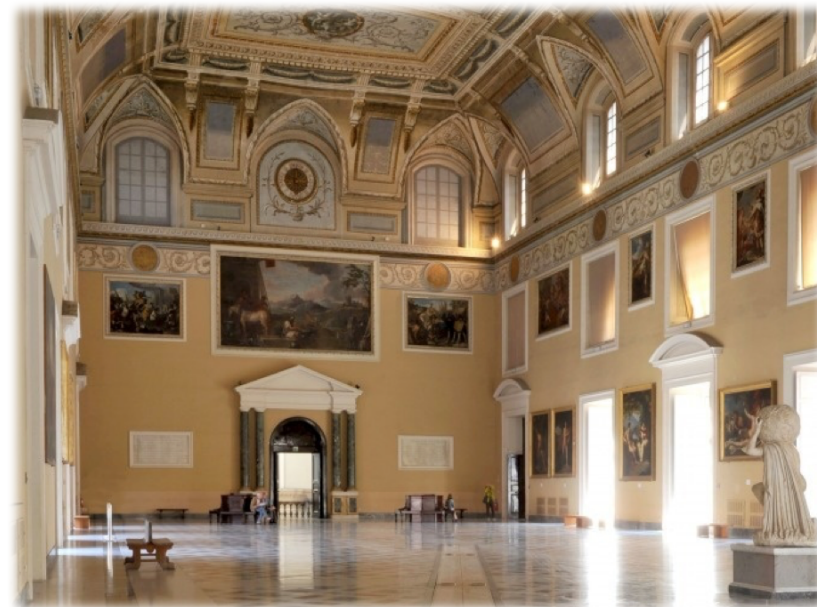
MANN - Napoli